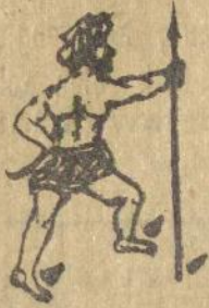
Boetoeha bodjak ninna Appandjoenggal.

Molo naeng laho tourne App. boea ton ni hadil. sai djoemolo do disapai manang adong do lapo parkopian di hoeta na tinopotna. Ai toeng na so aong go ninna sonang ni rohana molo so djolo marloehoet di lapo parkopian asa dipareso siparesoonna.