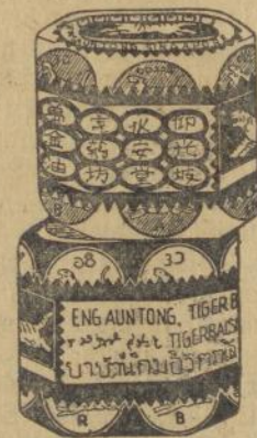
Dalem goetji ketjil merah dan poeti

Obat tjap Matjan tida boleh tida ada di toean poenja roemah, kerna tida ada obat lebih baek boeat semboehken. Rheumatiek, sakit boekoe toelang dan spier, kasaleo dan pilek dari pada ini obat oemoem. Djoega boeat laen-laen penjakit dan ganggoean obat tjap Matjan ada mandjoer. Tjoba soeroe toean poenja boedjang beli boeat satalen satoe goetji ketjil Obat Matjan. Toean pasti aken dapat kafaedahan dari ini.